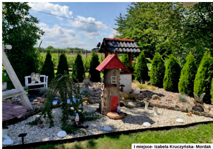
1 miejsce- Izabela Kruczyńska- Mordak