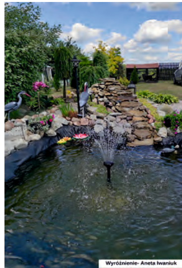
Wyróżnienie- Aneta Iwaniuk