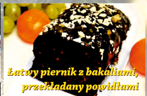
Łatwy piernik z bakaliami, przekładany powidłami

Kurczaka podzielić na części: odciąć piersi od kości, wyciąć udka i skrzydełka. Oprószyć ziołami prowansalskimi, solą i pieprzem, a także posmarować olejem. Zostawić drób w tak przygotowanej mieszance na najlepiej całą noc, a minimum godzinę. Grzyby zamoczyć na noc w wodzie, aby napęczniały. Następnie ugotować je do miękkości w posolonej wodzie i pokroić drobno. Boczek oraz cebulę pokroić w kostkę i podsmażyć na odrobinie tłuszczu. Kapustę kwaszoną spróbować – jeżeli wydaje się Wam mocno kwaśna, przelać wodą. Chociaż ja w tym daniu widzę właśnie dość kwaśny bigos. Włożyć go do garnka, dolać dwie szklanki rosołu i dodać przyprawy: liść laurowy i sól. Gotować do miękkości, nie odcedzać. Do kapusty dodać pozostałe składniki, czyli grzyby, podsmażony boczek z cebulką, koncentrat, słodką paprykę, pieprz, w razie potrzeby jeszcze sól. Całość gotować 10 minut. Odstawić. Bigos przełożyć do naczynia żaroodpornego. Jeżeli nie jest zbyt mokry, dolewamy jeszcze rosołu lub wody – powinien być luźny, by mięso go piło. Pomiędzy kapustę poukładać kawałki kurczaka. Danie pieczemy przez godzinę pod przykryciem i kolejne 20 minut bez, by całość się lekko zarumieniła. Temperatura 170 stopni.