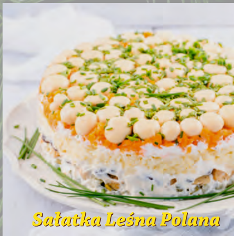
Sałatka Leśna Polana