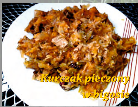
Kurczak pieczony w bigosie