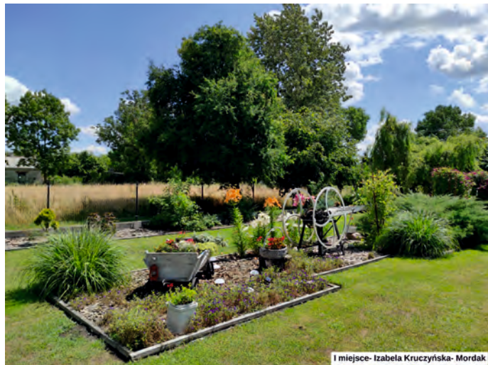
1 miejsce- Izabela Kruczyńska- Mordak