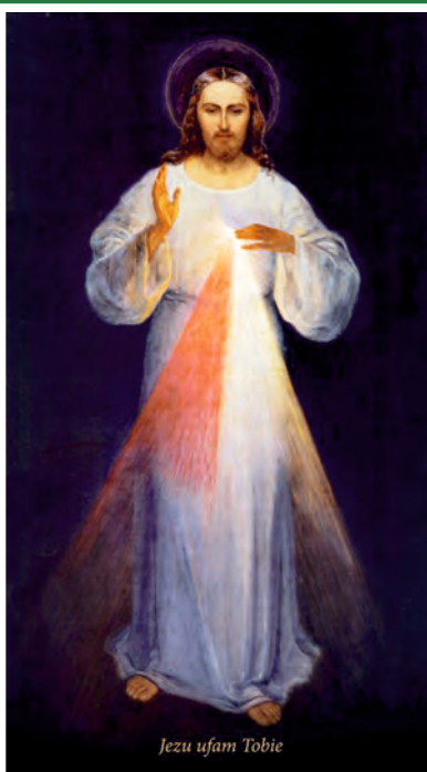
Jezu ufam Tobie

W tym wyobcowanym świecie, gdzie każdy przed każdym się zamyka, warto