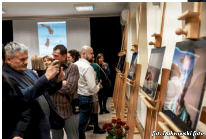
fol. Dąbrowski foto