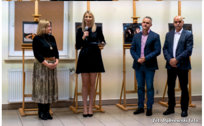
fol. Dąbrowski foto