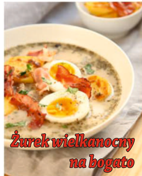
Żurek wielkanocny na bogato

1. Blaszkę 25×36 cm wykładamy folią aluminiową. Spód wykładamy biszkoptami. Nasączamy je delikatnie wodą z cukrem i sokiem cytrynowym. Galaretki cytrynowe rozpuszczamy w 500 ml wrzątku. Studzimy. Śmietankę ubijamy na sztywno. 2. Ser miksujemy z cukrem pudrem i galaretką cytrynową. Dodajemy ubitą śmietankę i delikatnie łączymy całość za pomocą różgi lub szpatułki (nie kiksujemy!!!). Masę wylewamy na biszkopty. Odstawiamy do stężenia. Galaretki przezroczyste rozpuszczamy w 500 ml wrzątku. Studzimy. 3. Brzoskwinie odsączamy z syropu. Układamy na wierzchu ciasta. Zalewamy tężejącą przezroczystą galaretką. Odstawiamy w chłodne miejsce – najlepiej na całą noc.