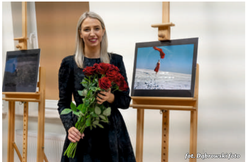
fol. Dąbrowski foto