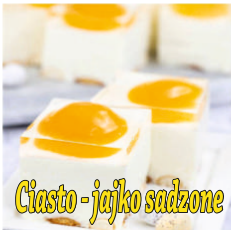
Ciasto - jajko sadzone

Masło w temperaturze pokojowej rozetrzeć płaską lub ubijającą końcówką miksera razem z cukrem pudrem. Ucierając dodawać po łyżce masy serowej. Na końcu w mieszać posiekane bakalie. Foremkę wyłożyć plastikową folią (elastyczna jest tu kłopotliwa, lepiej użyć zwykłej torebki foliowej) i na nią wyłożyć masę, dociskając porządnie z góry (również folią), by nie pozostały w środku puste pęcherze powietrza i nierówności. Włożyć do lodówki na 2-3 godziny do stężenia. Odwrócić na talerzu do góry nogami, postawić jak babkę z piasku. Delikatnie zdjąć formę i folię. Dowolnie udekorować deser.