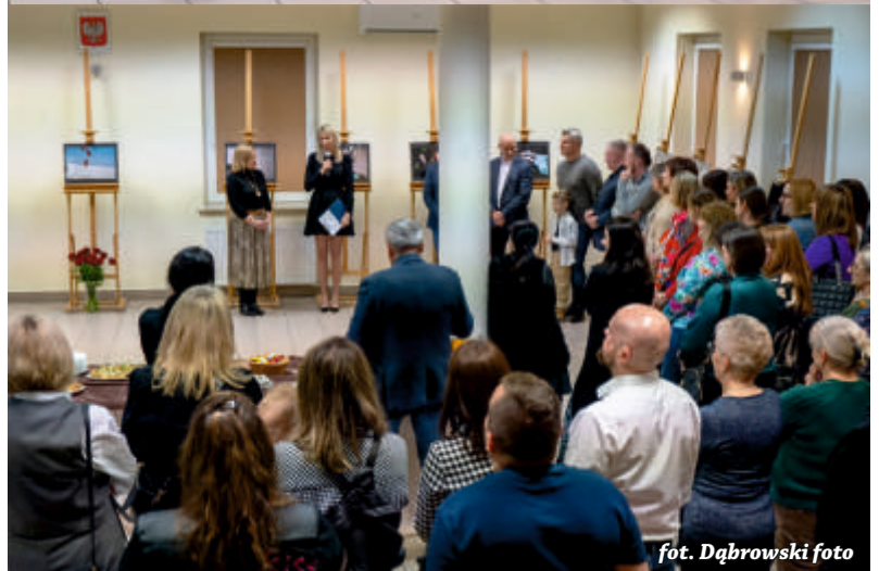
fol. Dąbrowski foto