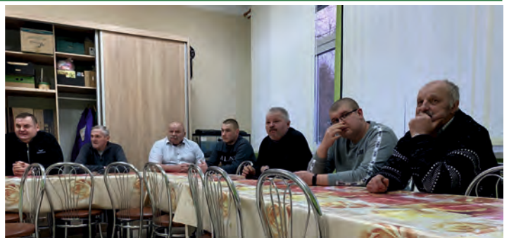
OSP Wola Korybutowa

Ze wszystkich jednostek jedynie OSP Siedliszcze brało udział w akcjach ratowniczo-gaśniczych. Jednostka OSP Siedliszcze to 16 dobrze przeszkolonych druhów w tym jedna kobieta. Aby zostać strażakiem osp należy przejść specjalistyczne badania, ukończyć kurs podstawowy trwający 20 dni roboczych i mieć ukończone 18 lat. Ochotnicza Straż Pożarna w Siedliszczu podjęła uchwałę w celu utworzenia Młodzieżowej Drużyny Pożarniczej. MDP powołano w celu szerszego zainteresowania młodzieży działalnością społeczną na rzecz ochrony przeciwpożarowej oraz przygotowania do bezinteresownej służby w szeregach OSP, jej członkami mogą być dziewczęta