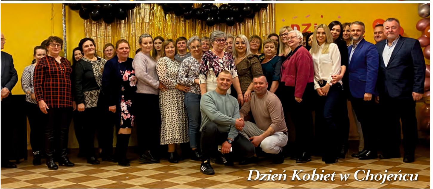
Dzień Kobiet w Chojńcu