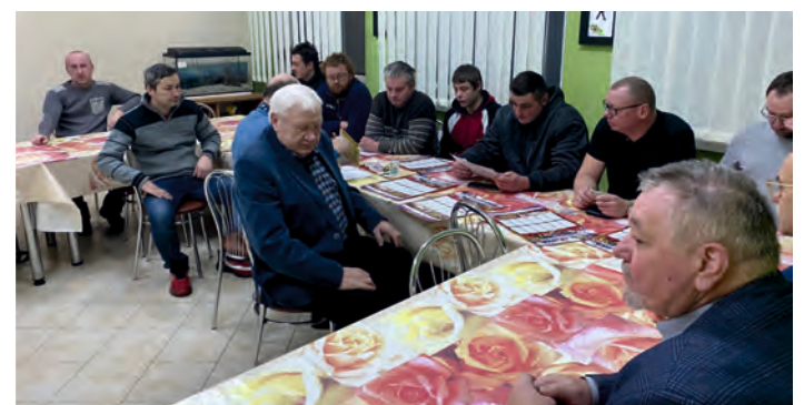
OSP Majdan Zahorodyński