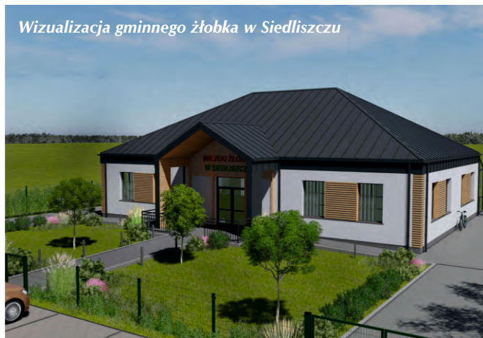
Wizualizacja gminnego żłobka w Siedliszczu

8. Budowa gminnego żłobka w Siedliszczu. Na tę inwestycję otrzymamy dofinansowanie od Wojewody Lubelskiego z programu Aktywny Maluch w wysokości 1 415 188,80 zł. na budowę żłobka dla 20 dzieci. Złożony został wniosek o otrzymanie decyzji na budowę tego obiektu, czekamy na podpisanie umowy o dofinansowanie. Następnie ogłosimy przetarg na budowę, inwestycja rozpocznie się i zakończy w 2025 roku. Według kosztorysu inwestorskiego, wartość inwestycji to 3 208 894,60 zł. ostateczną kwotę poznamy po przetargu.