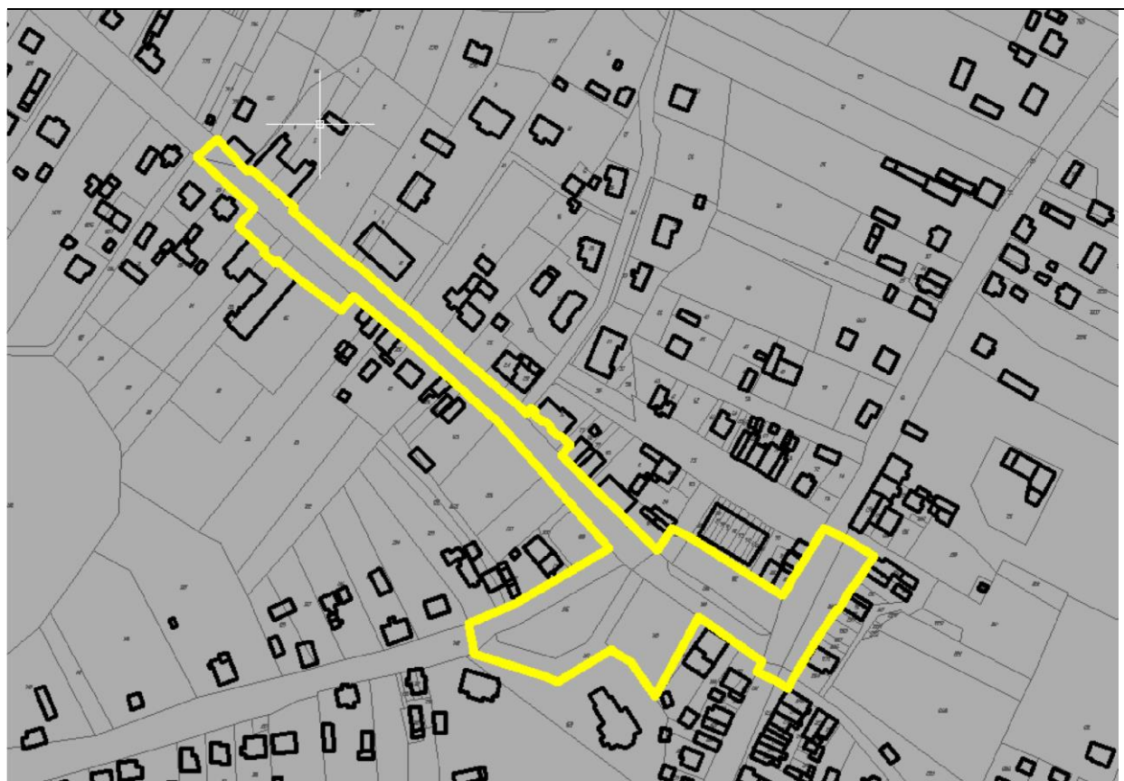
Rysunek 1. Obszar przestrzeni publicznej w mieście Siedliszcze

Ustalenia planów miejscowych i wszelkie działania dla obszaru przestrzeni publicznej należy koncentrować w szczególności na działaniach podnoszących jakość i znaczenie tego obszaru w strukturze zabudowy miasta i gminy. Dla obszaru przestrzeni publicznej w ciągu ulicy Szpitalnej zakłada się następujące kierunki działań: